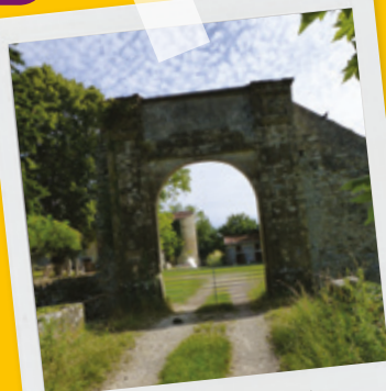
Vieux château Charentonnay

Situé sur le cours de la Vauvise, ce lavoir a été construit à la fin du XIX ème siècle. Illustrant le mouvement hygiéniste qui s'invite alors dans les campagnes françaises, l'ouvrage est de construction simple.