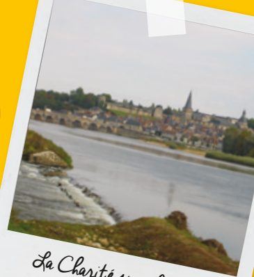
La Charité sur Loire

Historiquement située aux limites de la Bourgogne et du Berry, elle s'est développée autour d'un prieuré clunisien et de deux églises érigées par les moines en 1059, le tout protégé par des remparts et tours de ronde.