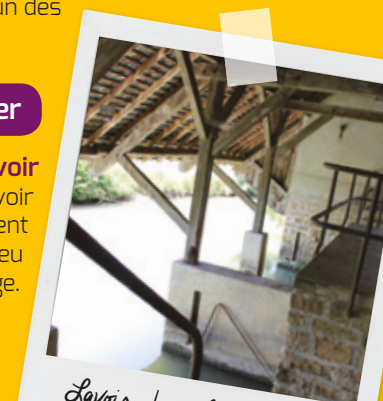
Lavoir Jussy le Chaudrier

Construit sur la berge de la Vauvise, ce lavoir date de la fin du XIX ème siècle. Exclusivement réservé aux femmes, l'ouvrage était un lieu propice à la convivialité et à l'échange.